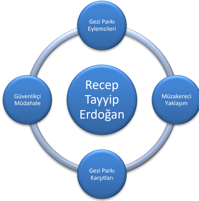
Şekil 1: Başbakan Recep Tayyip Erdoğan'ı "Etkileyen" Faktörler

Gezi Parkı Olayları boyunca Türkiye çapında yaklaşık 7 bin gösteri gerçekleştirilmiştir. Gösterilerin hareketliliğini sağlayan ve belirleyen en önemli değişken polisin "aşırı" şiddet kullanması olmuştur. Bu noktada güvenlikçi ve müzakereci tavrın arasında bir müdahale temposu ortaya çıkmıştır. Neticede Erdoğan, Gezi Parkı Olayları boyunca bürokrat, siyasetçi ve eylemcilerin arasında kalmıştır. Birkaç cephenin ürettiği politika "karmaşası" Gezi Parkı Olayları'nın başlamasında ve sürmesinde önemli bir "iç" kırılma olmuştur.